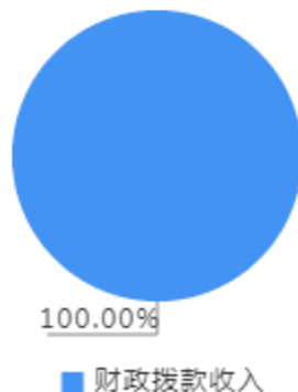
本年收入决算结构图

本年收入合计3,553.34万元，其中：财政拨款收入3,553.34万元，占100.00%。