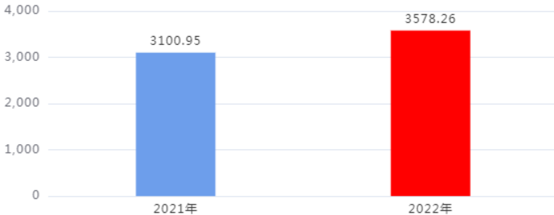
收、支决算总计变动情况图（单位：万元）

2022年度收、支总计3,578.26万元。与2021年度相比，收、支总计各增加477.31万元，增长15.39%。主要是奖金津贴由区财政统筹发放，年初未纳入预算，故存在差异，使经费增加。